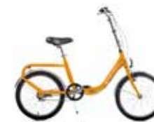
Vélos pliants (Caution de 467€)