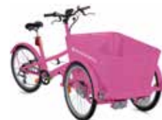
Vélos cargos à assistance électrique (Caution de 3476€)