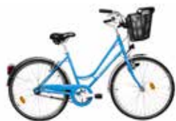
Vélos classiques (Caution de 268€)

Et une fois conquis par ces quelques mois d'essai, faites-vous plaisir : offrez vous un beau vélo!