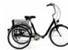
Tricycles pour adultes (Caution de 498€)