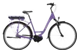
Vélos à assistance électrique (Caution de 1 350€)