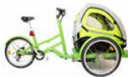
Vélos cargo family (Caution 3310€)